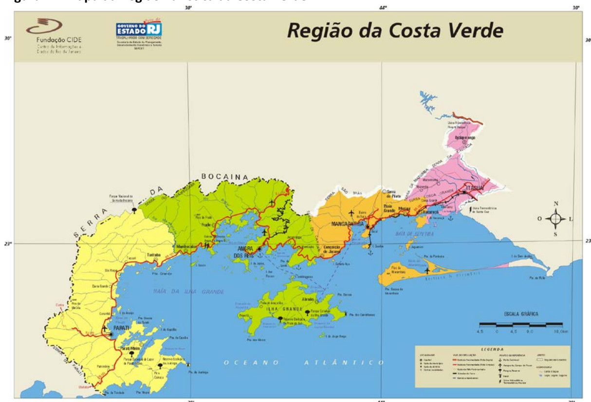
Figura 1 – Mapa da Região Turística da Costa Verde

Fonte: Fundação CEPERJ – Centro Estadual de Estatísticas, Pesquisas e Formação dos Servidores Públicos do Rio de Janeiro (Antiga Fundação CIDE).