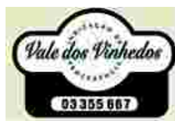
Figura 2: Selo de Indicação de Procedência

O Vale dos Vinhedos conquistou a primeira Indicação de Procedência (IPVV) do Brasil no ano de 2001. Outorgada pelo Instituto Nacional de Propriedade Industrial (Inpi), a IPVV iniciou com a delimitação geográfica da região 7 . Foram realizados estudos topográficos, topoclimáticos e foram relacionados os mapas de solos. A partir desses estudos, o Vale dos Vinhedos foi composto também por parte dos municípios de Monte Belo do Sul e de Garibaldi, e sua área geográfica ficou com 81,23 km 2 . Os vinhos aprovados podem ostentar um selo em suas garrafas, com uma numeração registrada no Inpi, garantindo sua procedência (figura 2).