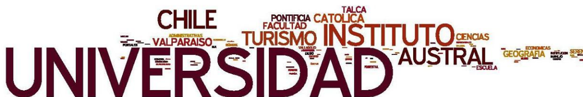
Figura 6 Instituciones de origen de los grupos de investigadores en Chile