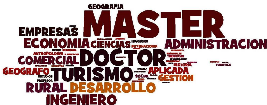
Figura 2 Nube de etiquetas de disciplinas, grados y postgrados de los autores