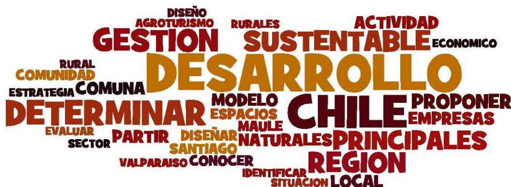
Figura 12 Nube de Temas y verbos rectores de los objetivos de las publicaciones