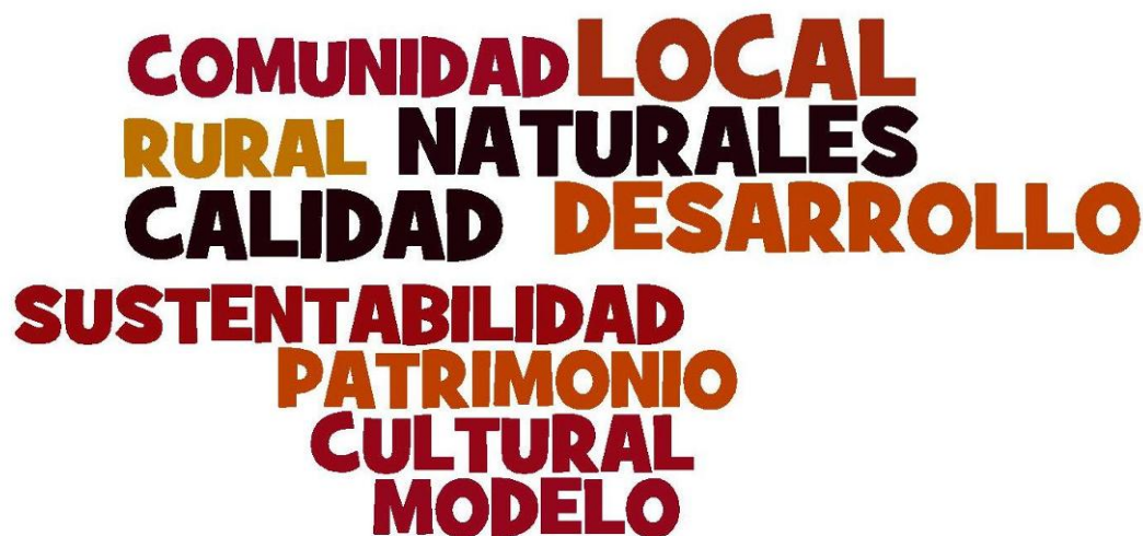
Figura 11 Nube de palabras clave, primeras 10.