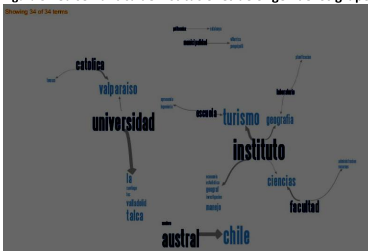
Figura 8 Red semántica de instituciones de origen de los grupos de investigación (Societur, 2007-2009)

Fuente: Elaboración propia, utilizando Many Eyes ©