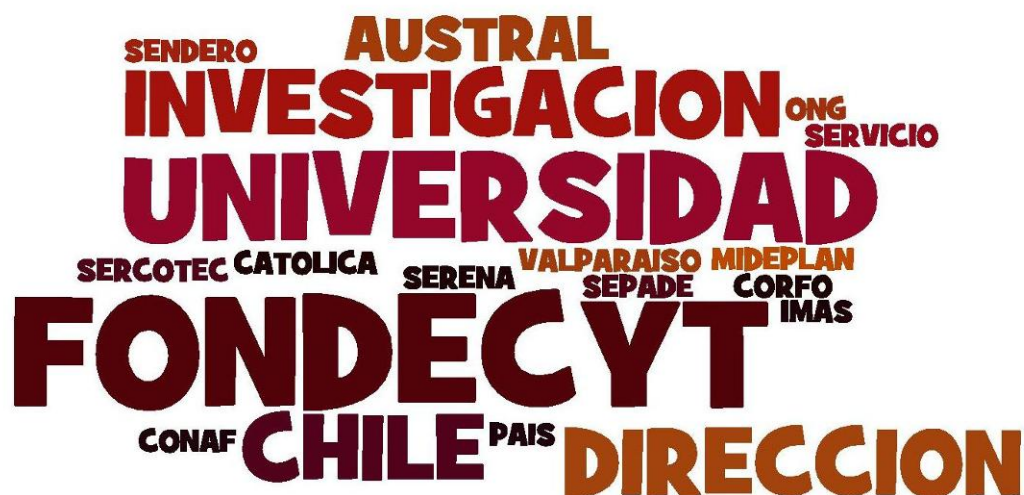
Figura 9 Nube de etiquetas con las fuentes de financiamiento de las investigaciones