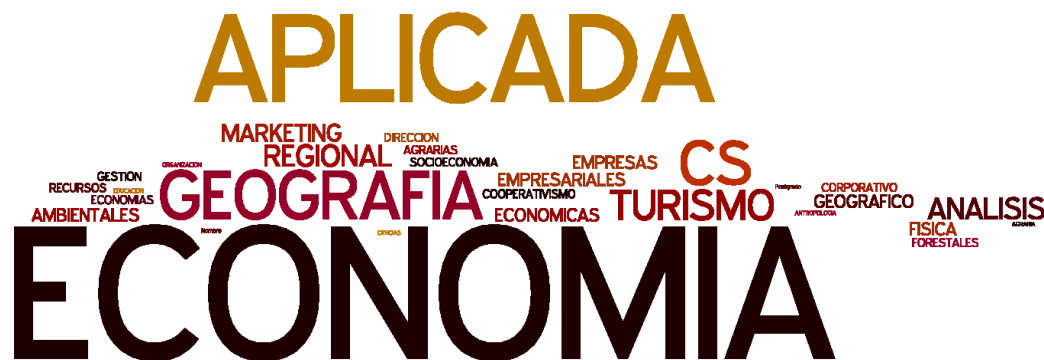
Figura 4 Nube de etiquetas con los nombres de los programas de doctorado de los autores.