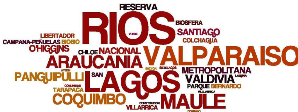
Figura 13 Territorios administrativos representados en las investigaciones