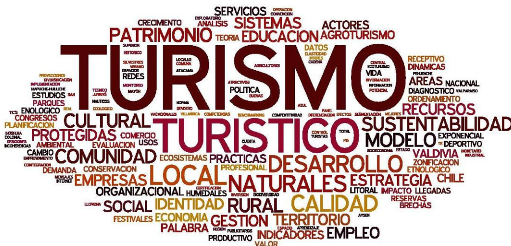
Figura 10 Nube de palabras clave total