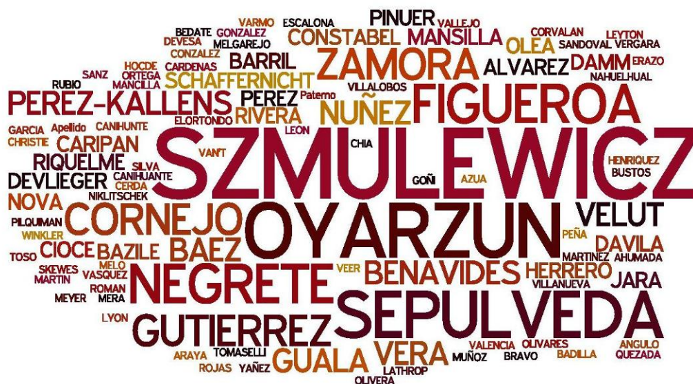
Figura 1 Nube de apellidos de autores de artículos para Congresos SOCIETUR 2007-2009

Fuente: Elaboración propia, utilizando Wordle ©