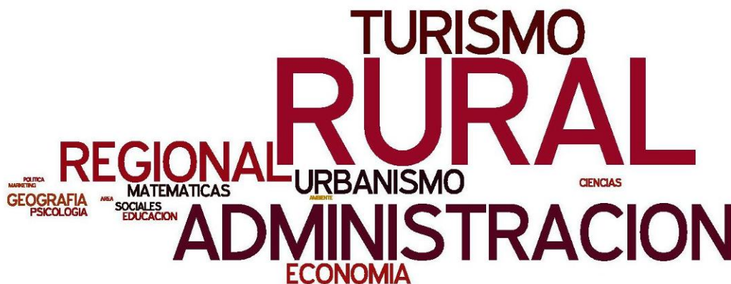
Figura 5 Nube de etiquetas con los sectores de los master de los autores.